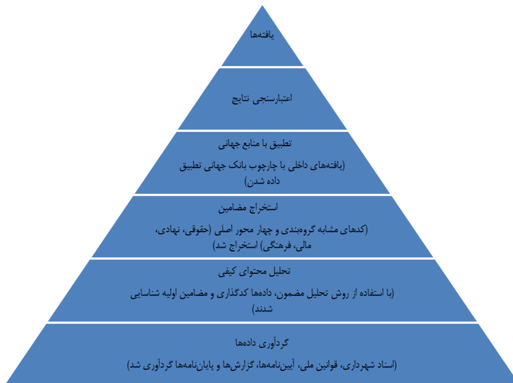
شکل ۱. مراحل اجرای روش تحقیق مقاله

شکل ۱ موارد یادشده را در فرایند روش تحقیق مقاله به صورت گام‌به‌گام نمایش می‌دهد. این فلوجارت نشان می‌دهد چگونه مراحل گردآوری داده‌ها، تحلیل مضمون، تطبیق با منابع جهانی و اعتبارسنجی چندمنبعی به صورت منسجم انجام شده تا به استخراج یافته‌ها و ارائه پیشنهادهای سیاستی منجر شود.