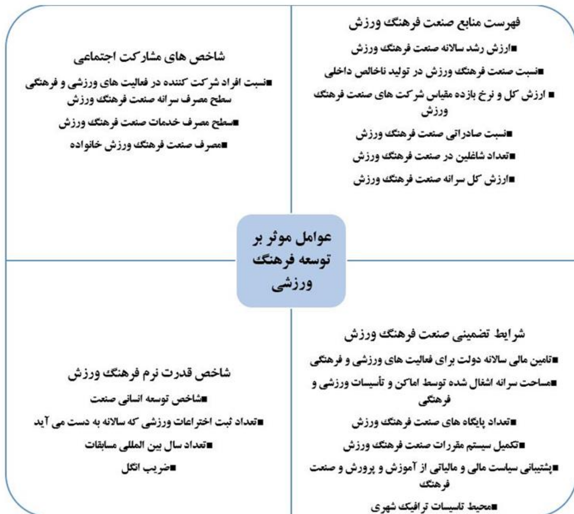
شکل ۱. عوامل مؤثر بر فرهنگ ورزش

این مدل تحت عنوان «عوامل مؤثر بر توسعه فرهنگ ورزشی» طراحی شده و به صورت چهار بخش اصلی دسته بندی شده است که هر یک شامل شاخص ها و عوامل کلیدی هستند. در ادامه توضیحات هر بخش ارائه می شود: